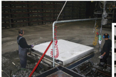
Het ontkisten van de plaat