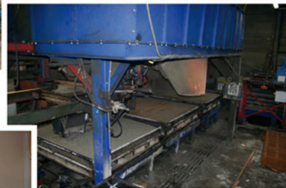
Het storten van het betonmengsel in de mallen