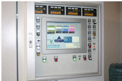
Computergestuurde controle van het proces