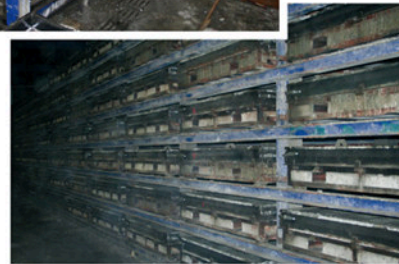
De platen tijdens de uitharding