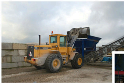
Het vullen van de opvoerband voor de menger