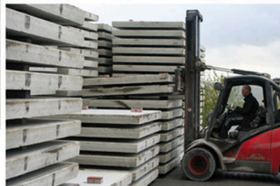
De voorraad gereed product